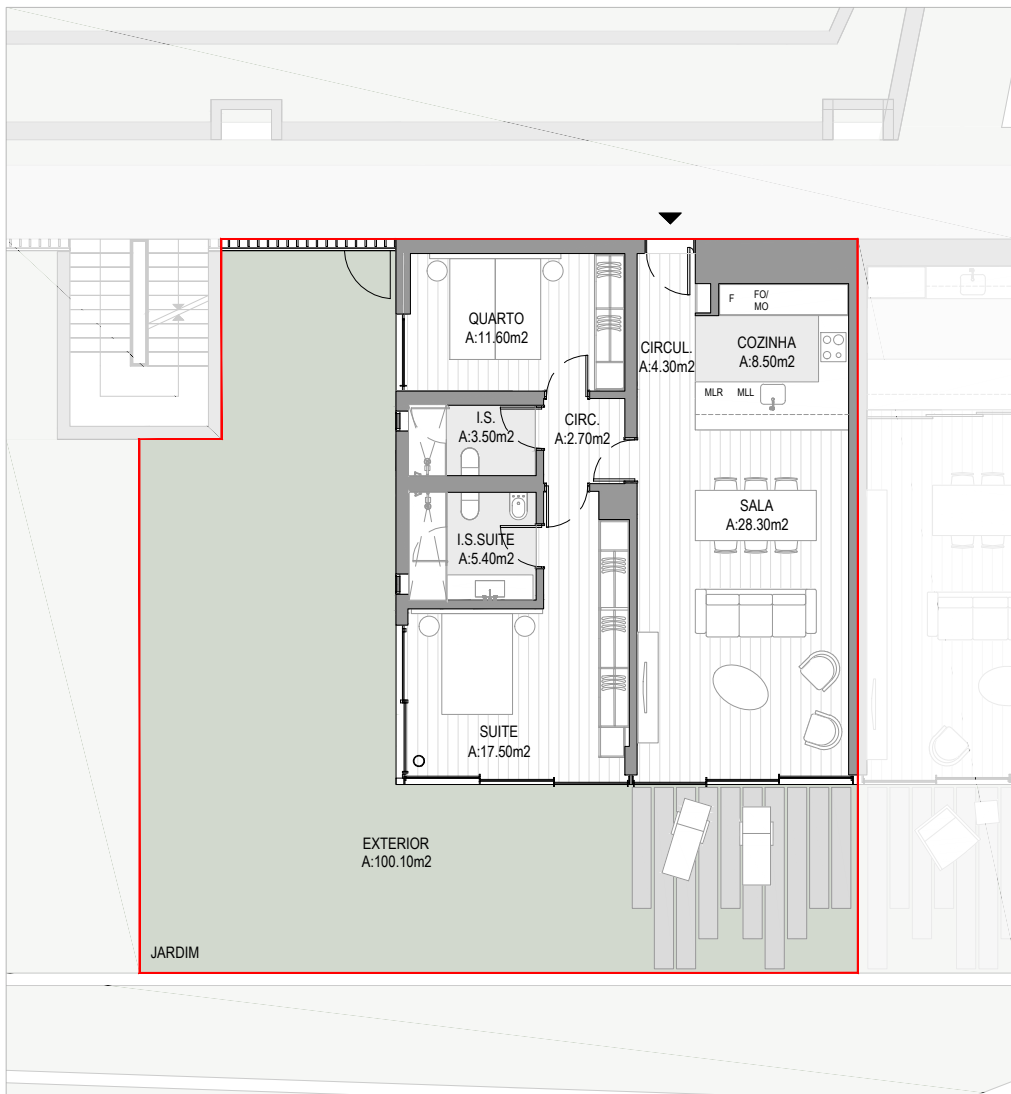
PLANTA | SEM ESCALA