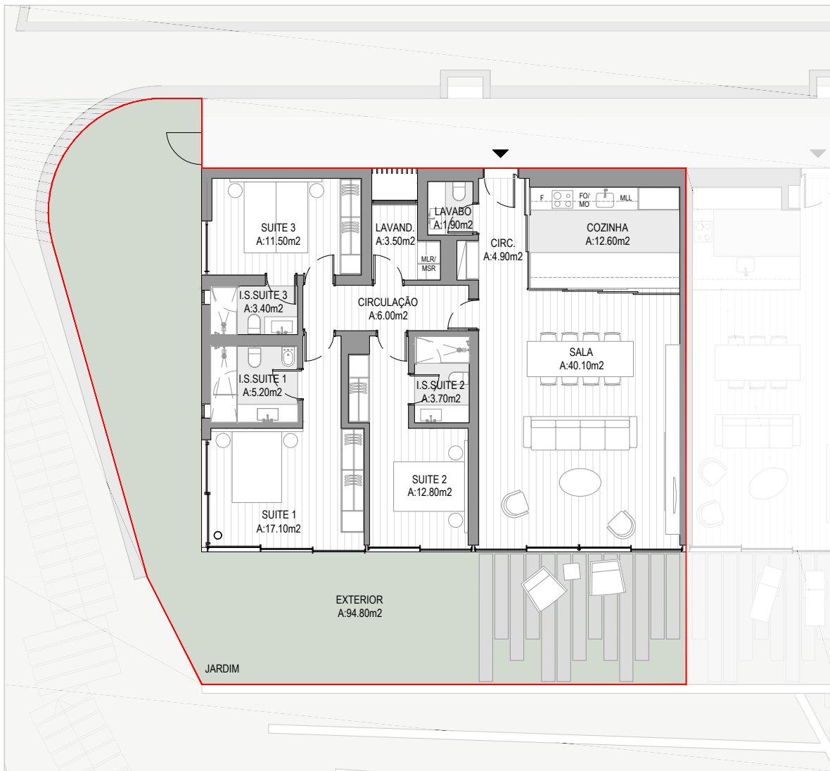
PLANTA | SEM ESCALA