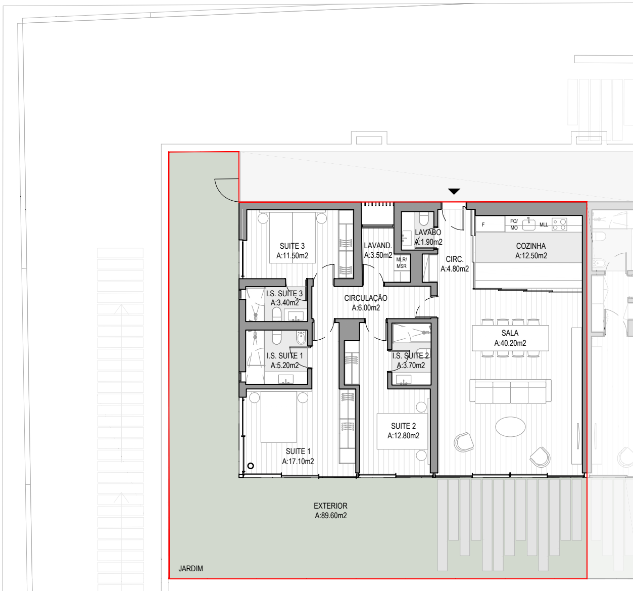
PLANTA | SEM ESCALA