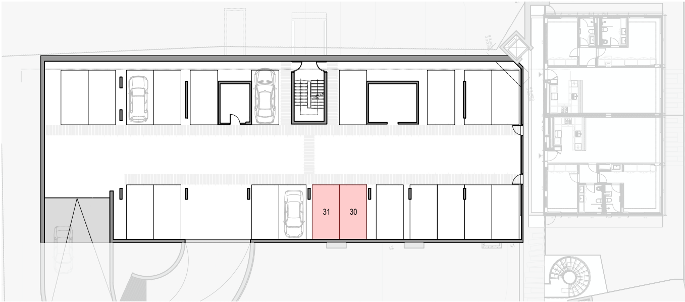
PLANTA ESTACIONAMENTO - PISO 02 | SEM ESCALA